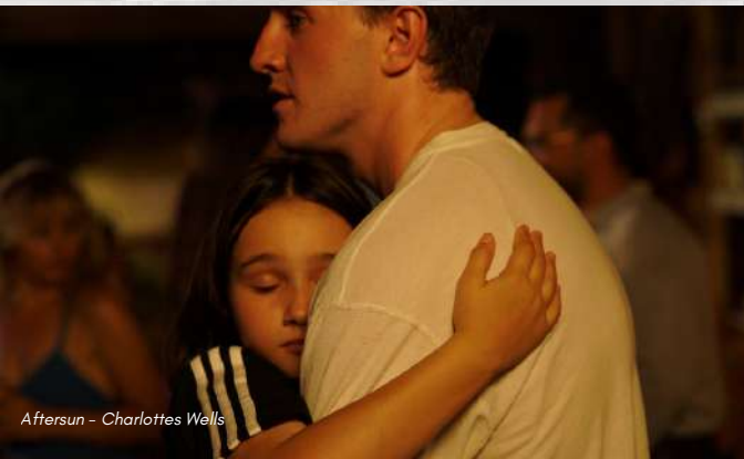
Aftersun - Charlottes Wells